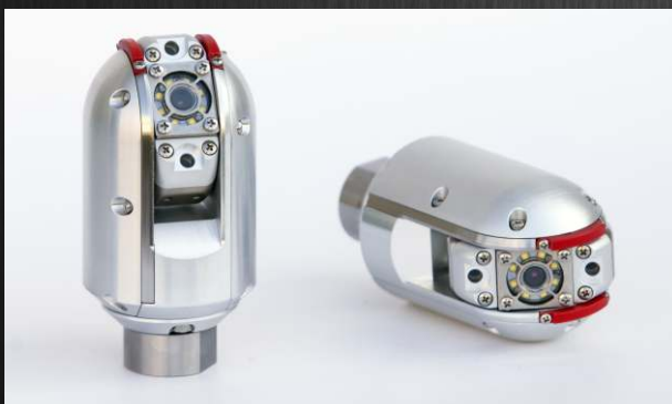
Opce: rotační kamerová hlava

Systém lze používat i s rotační a výkyvnou kamerovou hlavou (opce). Tuto je možno snadno a rychle zaměnit se standardní axiální kamerovou hlavou KA46. Výkyv i rotace jsou ovládány joystickem na ovládacím boxu, v němž je zároveň instalován systém pro kompletní ovládání technologie (nulová poloha, automatické pohledy kamerové hlavy atd.)